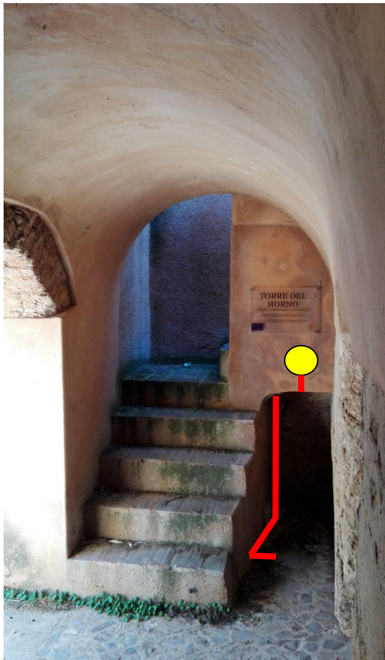
DETALLE 1ª CÁMARA TORRE DEL HORNO

● PUNTO DE LUZ — SUMINISTRO ELECTRICO PARA PUNTO DE LUZ