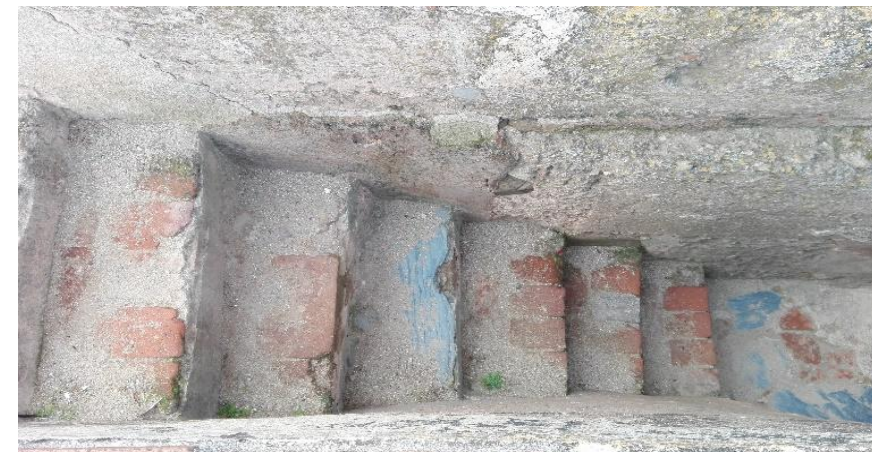
SEGUNDO TRAMO DE ESCALERAS DE ACCESO A LA TERRAZA