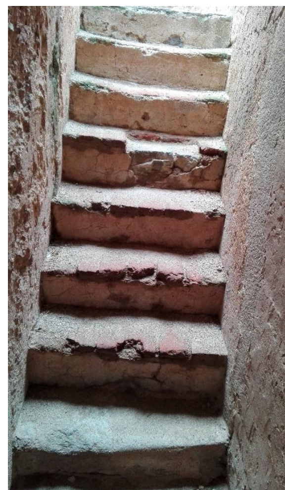
PRIMER TRAMO DE ESCALERAS DE ACCESO A LA TERRAZA