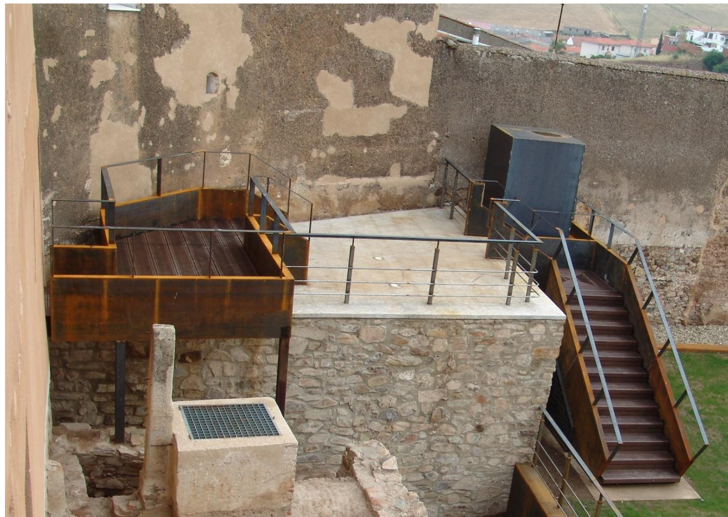
ESTRUCTURA DE ESCALERA Y MESETA INTERMEDIA DE ACCESO AL JARDÍN-MIRADOR