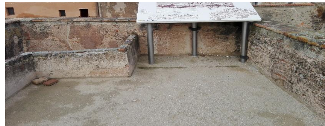
VISTA PARCIAL DE LA TERRAZA