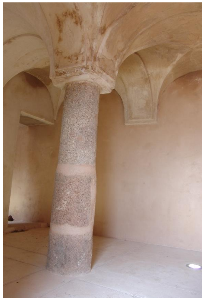
CÁMARA DE LA TORRE ALMOHADE