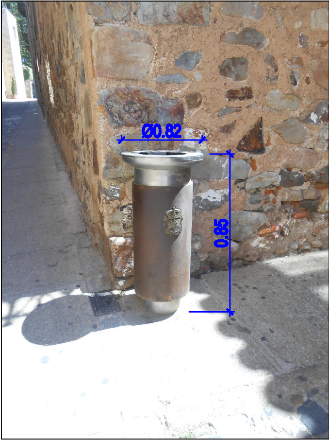
PAPELERA DE ACERO Y MADERA (Modelo ciudad monumental).